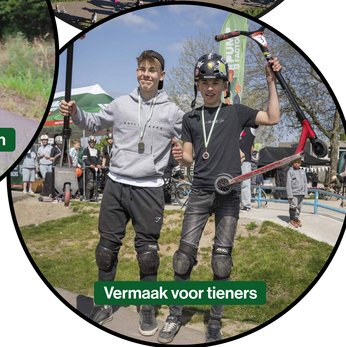
Vermaak voor tieners