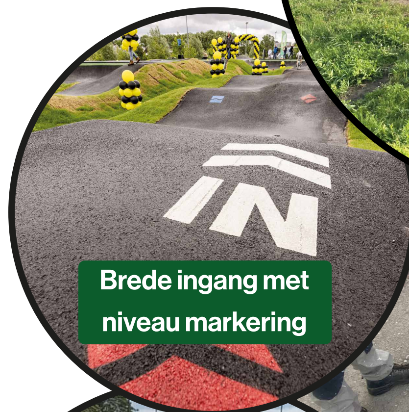
Brede ingang met niveau markering