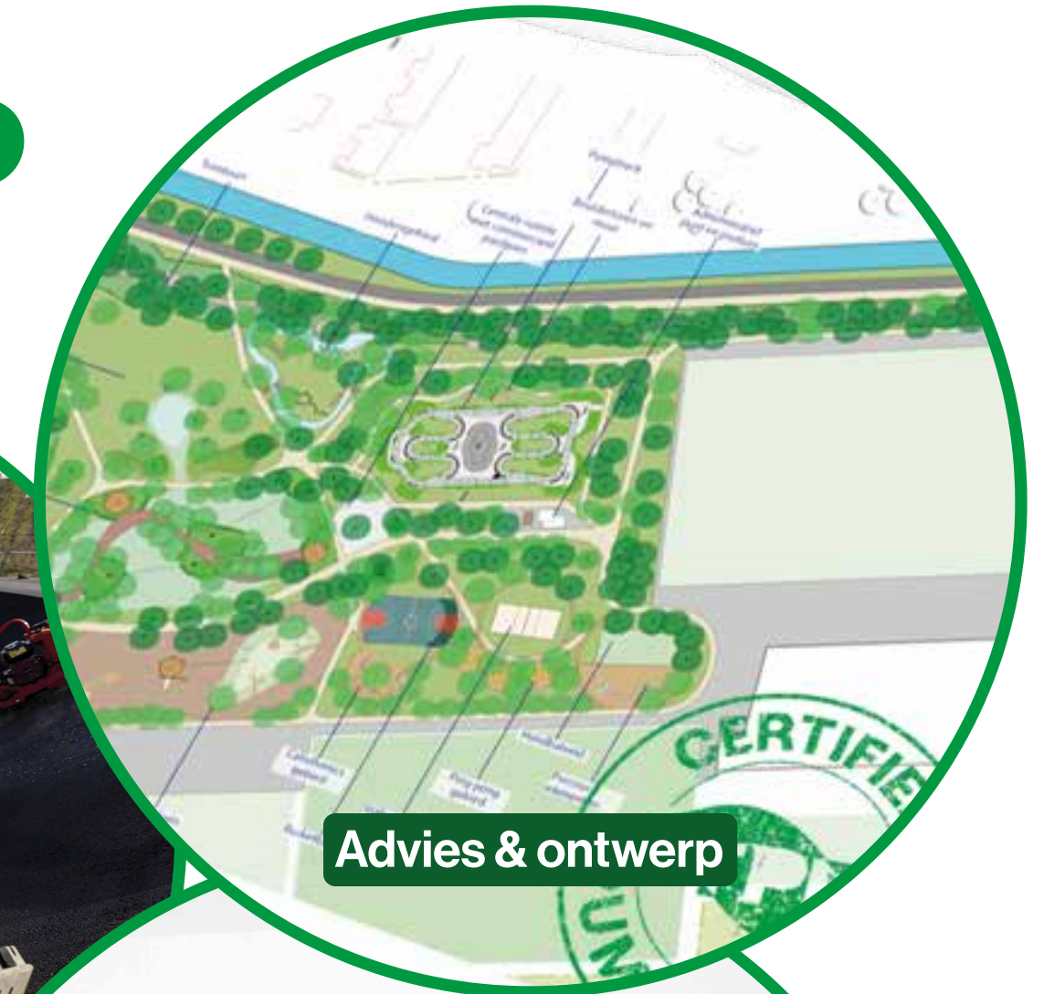
Advies & ontwerp