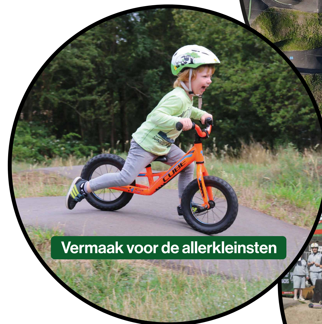
Vermaak voor de allerkleinsten